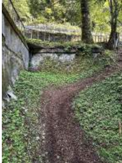
18日(日)大会終了後撮影