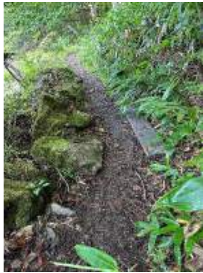
18日(日)大会終了後撮影