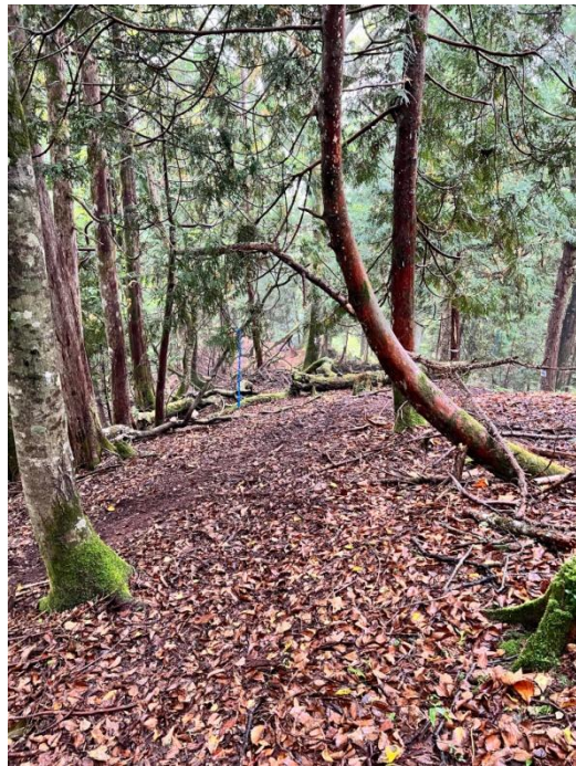
18日(日)大会終了後撮影